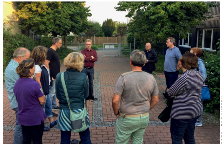
Grüne informieren sich über die Raum-Situation der Theodor-Heuss-Schule.

Beim Neubau der neuen Grundschule sollte sich Ronnenberg nach Ansicht der Grünen an der Marie-Curie-Schule (MCS) orientieren. Hier ist es gelungen, räumlich eine sehr positive Lernatmosphäre zu schaffen. Trotz des großzügigen Baus sowohl bei den Größen der Unterrichtsräume als auch den Fluren, konnte der Bau preiswerter, als es die anfängliche Kostenschätzung ergab, abgeschlossen werden. Wir