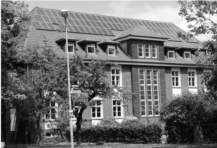
Die erfolgreiche Bürgersolaranlage auf dem Ronnenberger Rathausdach.